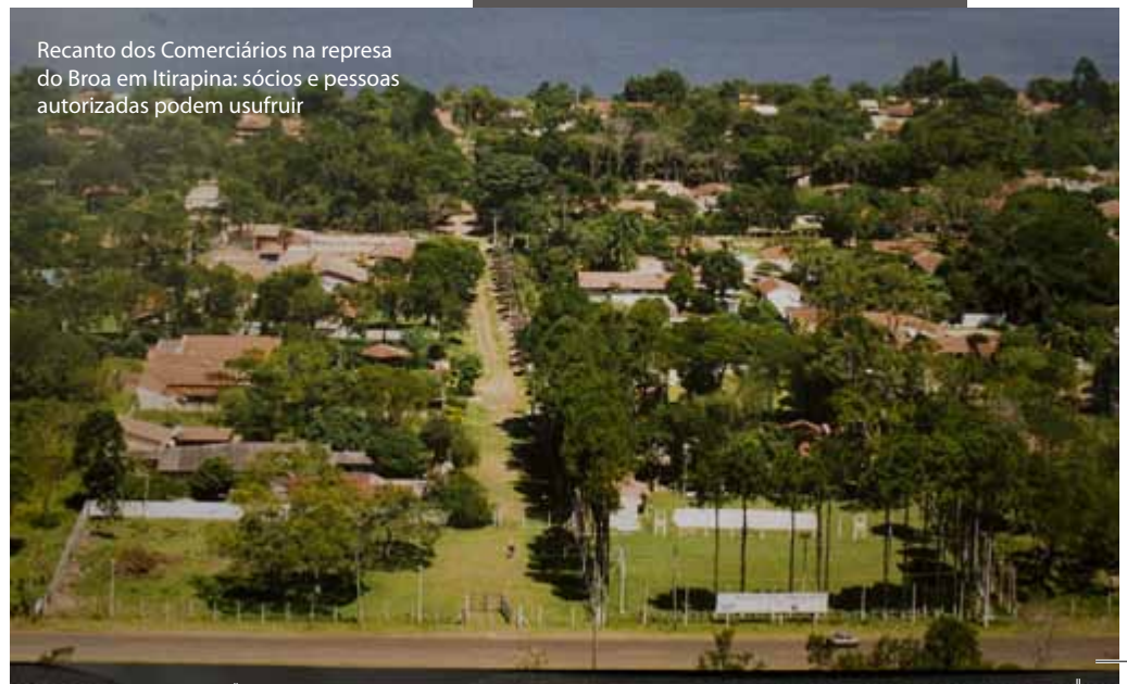
Recanto dos Comerciantes na represa do Broa em Itirapina: sócios e pessoas autorizadas podem usufruir