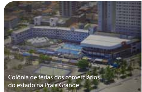
Colônia de férias dos comerciantes do estado na Praia Grande